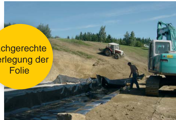
fachgerechte Verlegung der Folie