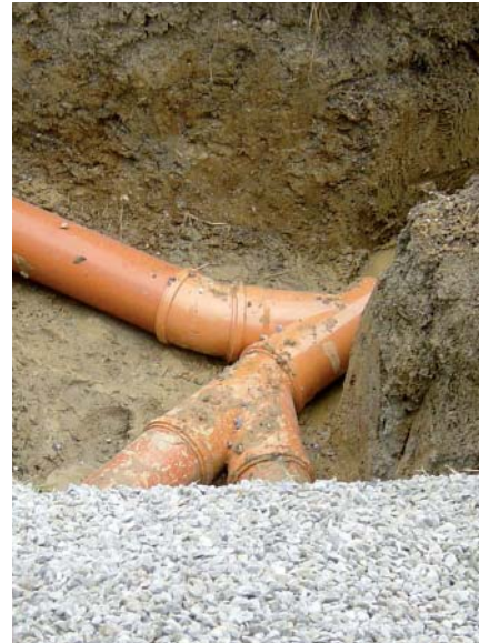
Rohrverlegungen für Abwasser, Regenwasser, Drainagen ...