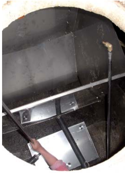
Kleinkläranlagen: System AKKA Umbau bestehender Senkgruben