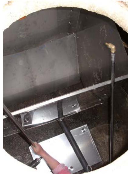
Kleinkläranlagen: System AKKA Umbau bestehender Senkgruben