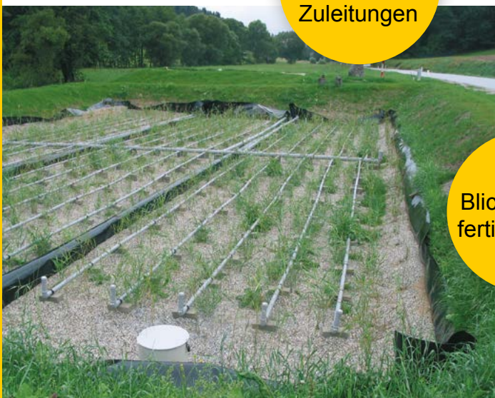
Blick auf Ihre fertige Anlage