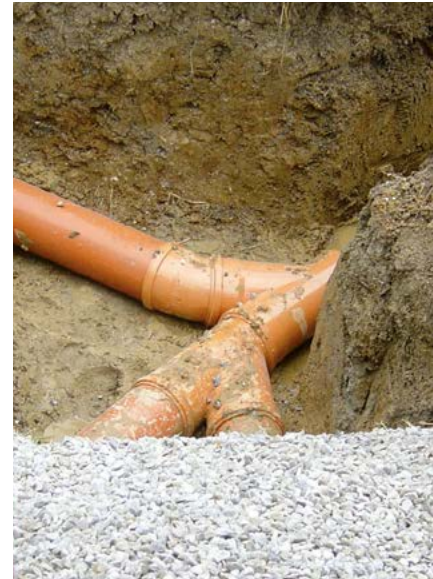
Rohrverlegungen für Abwasser, Regenwasser, Drainagen ...