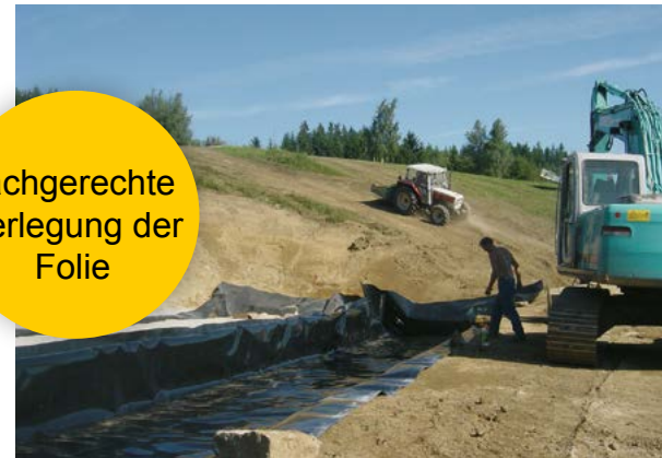
fachgerechte Verlegung der Folie