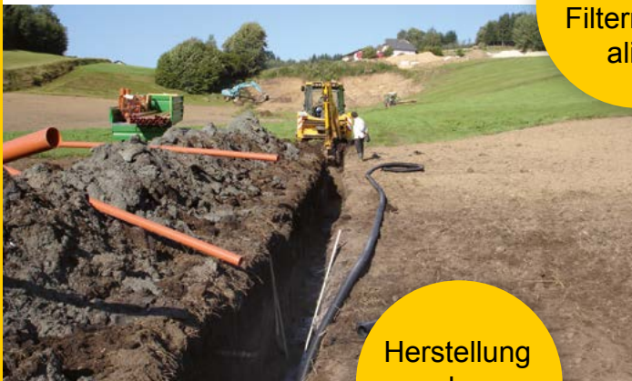
Einbau der Filtermateri- alien